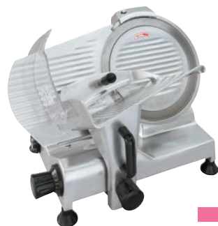
スーパー 焼肉店、しゃぶしゃぶ店