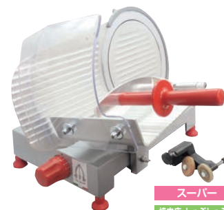
スーパー 焼肉店、しゃぶしゃぶ店