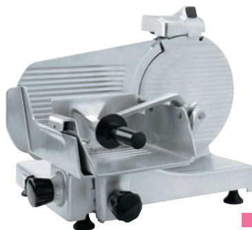
スーパー 焼肉店、しゃぶしゃぶ店