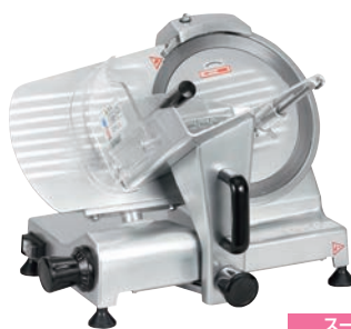
スーパー 焼肉店、しゃぶしゃぶ店