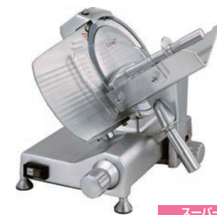
スーパー 焼肉店、しゃぶしゃぶ店