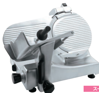
スーパー 焼肉店、しゃぶしゃぶ店